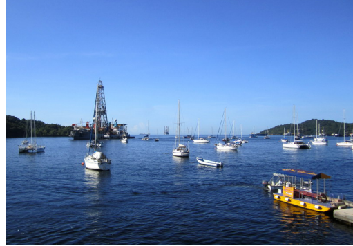
Utsikt från vår lilla lägenhet, med watertaxin i högerhörnet och en oljesuppleiebåt på väg in.