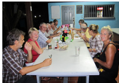
Lördagkväll med svenskägnet