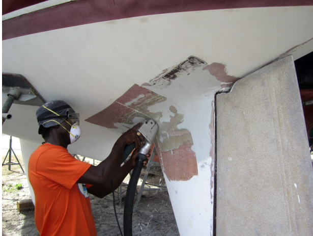
Cow slipar, skär, bygger upp, slipar, putsar...

Efter ett par dagar flyttade vi in i båten och nu startade arbetet med att få båten tiptop inför sjösättning. Tusen och en småsaker skulle fixas och under tiden fortsätter arbetet med botten på seaQwest. Innan vi åkte hem skrapades all gammal bottenfärg bort och då dök det tyvärr också upp ett par gamla skador. En är sedan båten var nästan ny, då man plastade framför skäddan och där det nu blivit blåsor. Innebär att allt nu slipas ner och att man, efter att det torkat ut, bygger upp med ny glasfiber. Den andra är en reparation efter att vi gått på en sandbank i Danmark för några år sedan. Då lämnade vi upp båten till Najadvarvet för att det skulle bli riktigt gjort och ändå måste reparationen nu göras om!