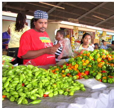
Ett par av alla dessa marknadsstånd i Port of Spain

Så hände det vi fasat för! Stormvarning för Trinidad & Tobago! Tropiska stormen Tomas bildades en fredag eftermiddag ca 30 mil öster om Tobago och rörde sig mot väst-nordväst. Stormvarning utfärdades för hela södra Karibien och ett intensivt väderkollande startade. På radio, VHF, tidningar och TV rapporterades hela tiden dessa dagar om utvecklingen och vi hade datorn igång och hämtade väderfiler via Internet. Allt löst på däck surrades eller stuvades undan. Trinidadborna bunkrade, såväl matvaror som bensin och liknande. Stormen utvecklades men gick lite nordligare och passerade under lördagen över först Barbados & sedan St. Lucia, St. Vincent m.fl. samtidigt som den blev till en orkan.