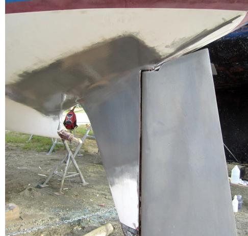
Till slut blev det så här fint!